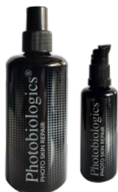
PHOTO SKIN REPAIR Foto-reparación de la Piel

Emulsión antioxidante que actúa neutralizando los radicales libres y contrarrestando los efectos del estrés térmico producido por la fotodepilación, tales como la alteración, la irritación y el prurito o picor en la piel. Con propiedades calmantes, rehidratantes, antiinflamatorias y reestructurantes.